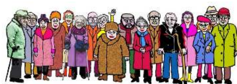
Bedsteforældre for Asyl

Pris: 40 kr. (inkl. kaffe/te, kage, frugt og vand)