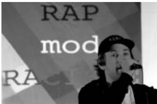
Mund de Carlo