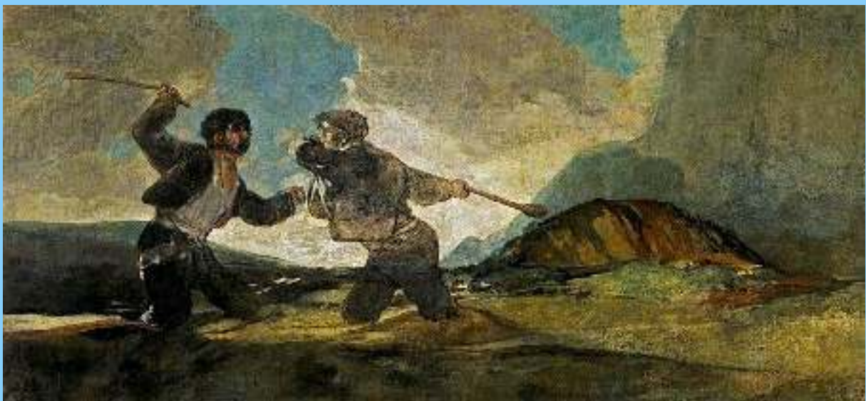
Francisco de Goya: Duelo a garrotazos, Museo del Prado, Madrid