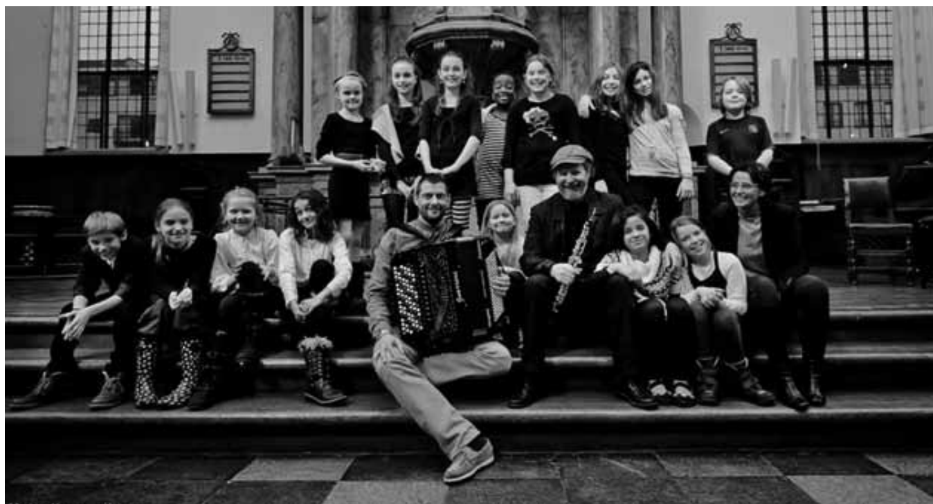
Goldschmidt & Singh

Det personlige møde er meget afgørende for vores opfattelse af vores medmennesker. Vi er ofte tilbøjelige til at være skeptiske og måske endda afstandtagende over for mennesker, der har en helt anden baggrund end vores egen. Manu Sareen.