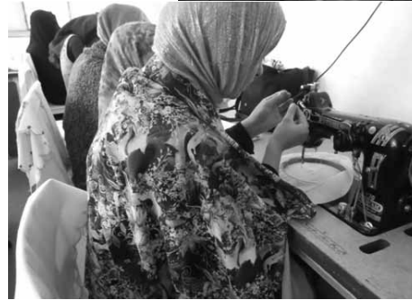
To grupper af unge kvinder fra DAC's broderikursus